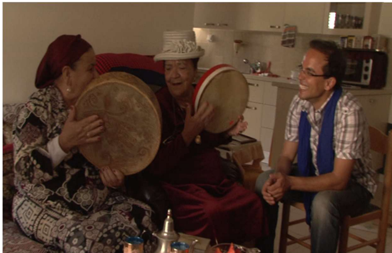
Figure 1 : Hachkar, en Israël, en compagnie de femmes juives.

Le spectateur, en même temps que le cinéaste, découvre ce passage et ce mouvement intellectuel d'une culture vers l'autre. La caméra illustre ce passage dans la mesure où elle se focalise, dans un premier temps, sur les visages en gros plan, pour réaliser ensuite un mouvement de la découverte de signes interculturels. Nous citons à titre d'exemple, le Mellah qui témoigne de la présence des juifs sur la terre marocaine et les femmes juives, en Israël, qui chantent, jusqu'à présent, des chansons d'expression amazighe (Fig. 1).